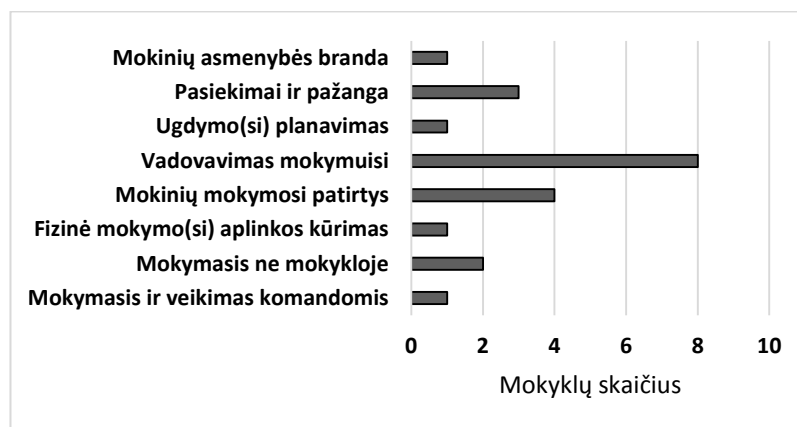
3 pav. 2019 m. bendrojo ugdymo mokyklų pasirinktos tobulinti veiklos sritys

mokinių mokymosi procesui, t. y. mokymosi kokybės gerinimui, mokinių įtraukimui į aktyvų mokyklos gyvenimą. Ginkūnų, Gilvyčių mokyklos, Gruzdžių gimnazija ir KLIB 2019 metais sieks geresnių mokinių mokymo(si) ir ugdymo(si) rezultatų (mokinių asmenybės brandos, mokymosi pasiekimų ir pažangos) (3 pav.).