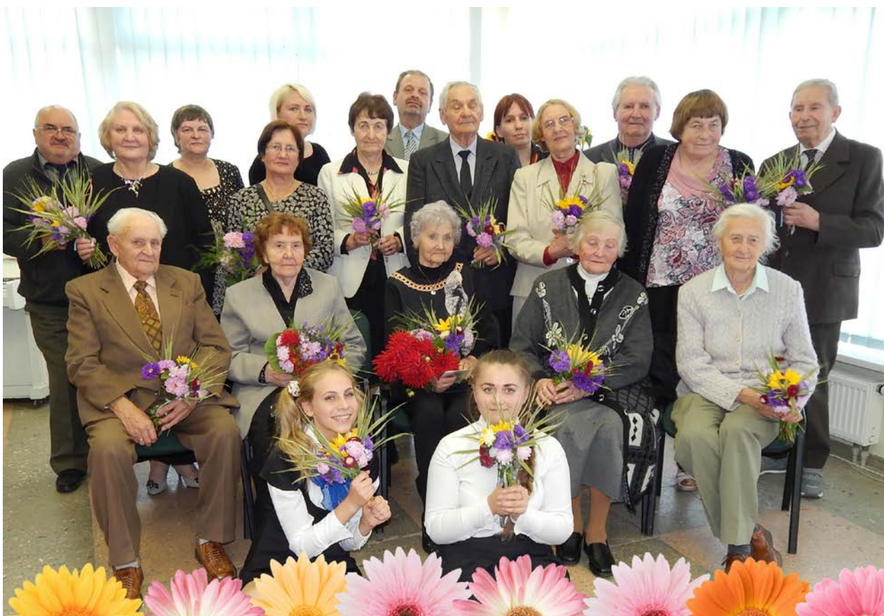
3pav. A.Griciaus bibliotekoje pagerbti buvę Gruzdžių mokytojai.