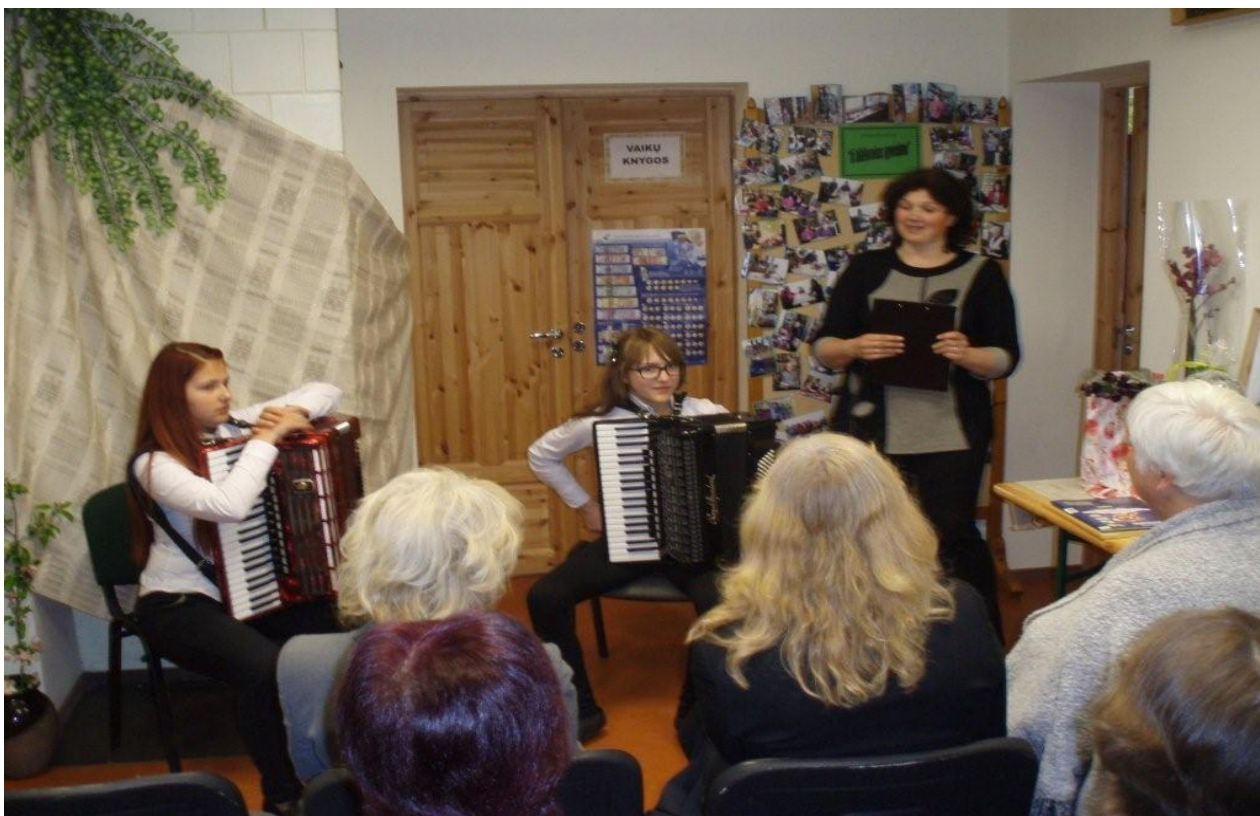
2. pav. 2015 m. gegužės 14 d. Šiaulių r. sav. viešosios bibliotekos Šiupylių filiale vyko graži šventinė popietė „Gera ir šilta mūsų bibliotekoje“. Biblioteka persikėlė į bendruomenės namus.