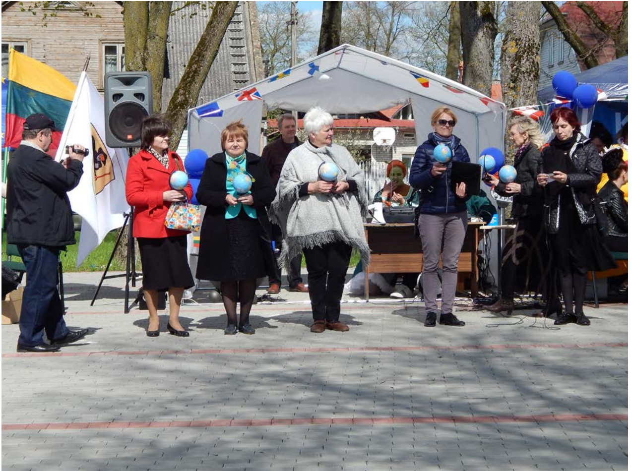
4 pav. Dalyvauta Šiaulių rajono savivaldybės viešosios bibliotekos projekte „Mūsų planeta- mūsų bendras rūpestis“.