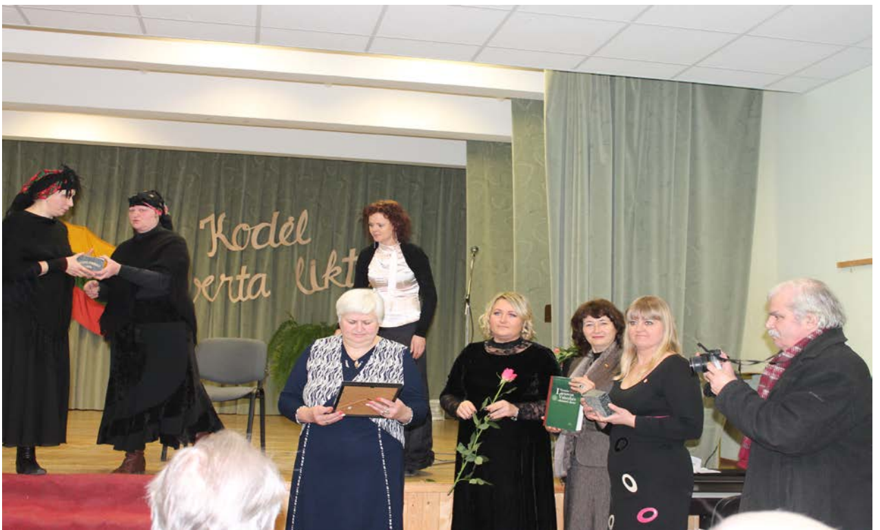
Renginys „Grudžių šviesuolis“. Jo metu pagerbti, savo darbais nusipelnusieji Grudžiams gyventojai.