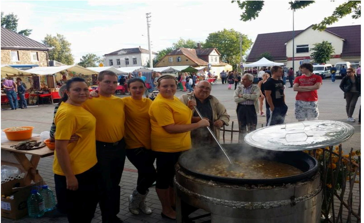
Grudžių krašto bendruomenės narių verdamas plovaviršelis šv. Roko šventės metu, Grudžių miestelio aikštėje.