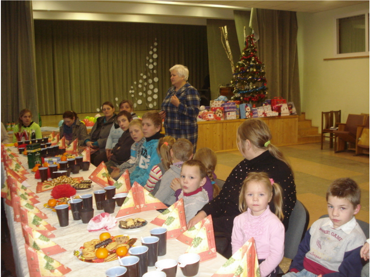
Kalėdinės šventės akimirkos.