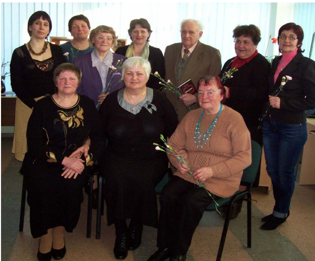
Popietė su eiliuotojų klubo „Girstulė“ nariais A.Griciaus bibliotekoje

Šiupylių bibliotekoje per metus užregistruota 150 skaitytojų, 105 suaugusieji, 45 vaikai. Literatūros išduota iš viso 2987 fiz. vnt. Suaugusiems išduota literatūros 1879 fiz. vnt. Vaikams išduota 1108 fiz.vnt. Gautas 7 siuntos knygų, visus metus biblioteka gavo „Šiaulių kraštą“, pusė metų „Mano ūkis“, skaitytojai atnešdavo į biblioteka žurnalų. Organizuotas 41 renginys: 20 renginių suaugusiems, 21 renginys vaikams.